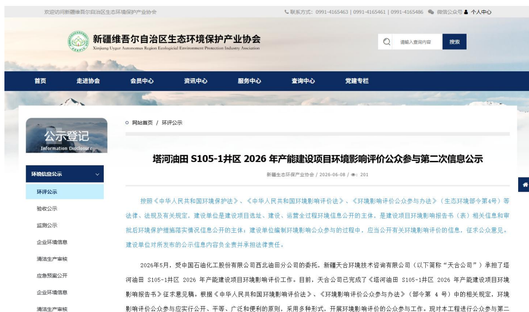
图3.2-1 本项目征求意见稿网络公示截图