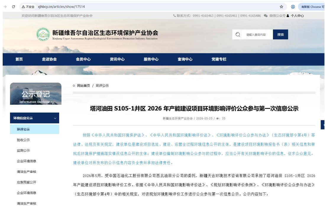
图2.2-1 本项目第一次网络公示截图