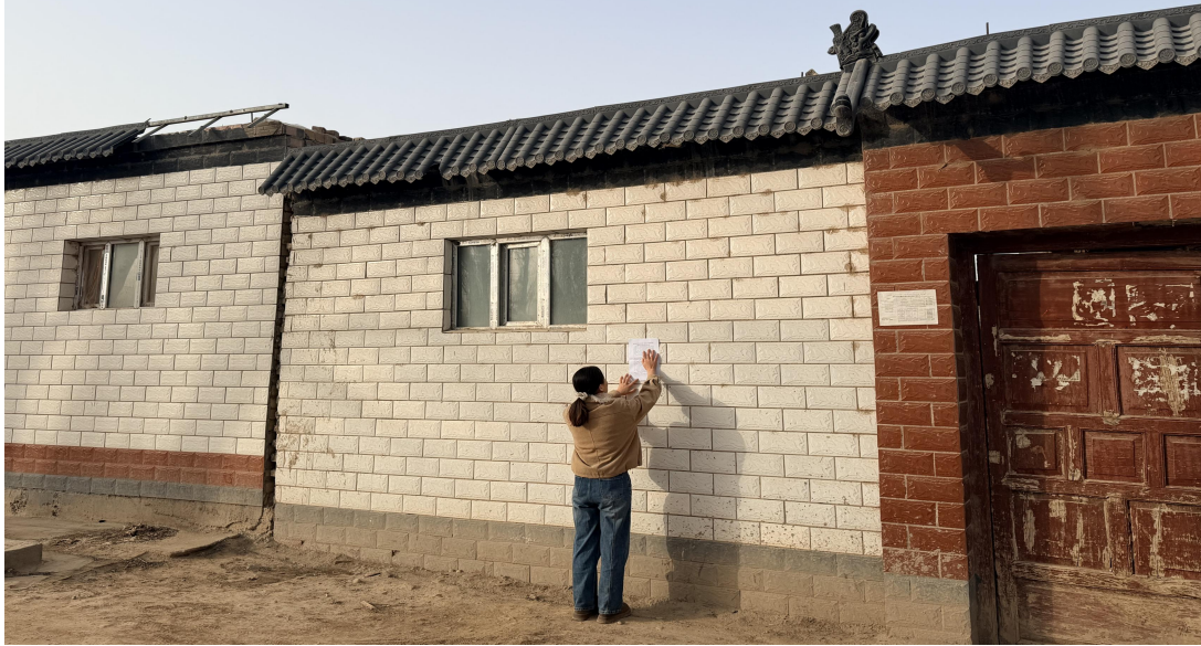
图3.2-3 本项目张贴公示栏照片

在第二次公示期间，本项目在项目所在地公示栏进行了张贴公示，载体选择符合《环境影响评价公众参与办法》要求。张贴公示照片见图3.2-3。